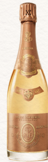
CRISTAL LATE RELEASE