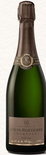
MILLÉSIMÉS LATE RELEASE